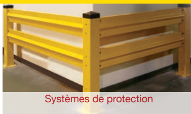
Systèmes de protection