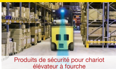
Produits de sécurité pour chariot élévateur à fourche