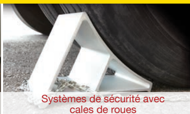
Systèmes de sécurité avec cales de roues